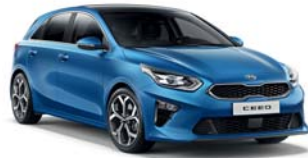
BLUE FLAME (B3L) 2