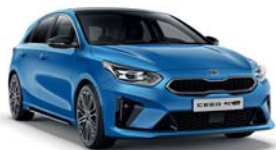
BLUE FLAME (B3L) 2