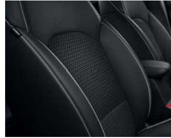
GOLD WK - Schwarz Textilsitze mit Kunstlederapplikationen