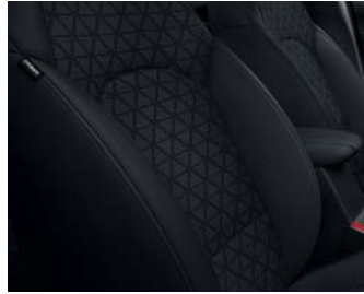
SILBER WK - Schwarz Textilsitze