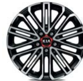
GT Leichtmetallfelgen 18 Zoll mit 225/40 R18 Bereifung