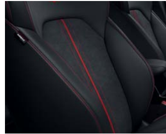
GT WK - Schwarz Veloursledersitze mit Echtleaderapplikation