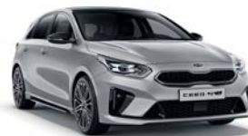
SPARKLING SILVER (KCS) 2