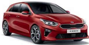
INFRA RED (AA9) 2*