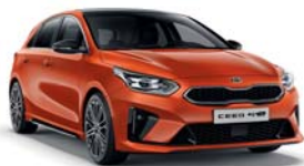
ORANGE FUSION (RNG) 2*