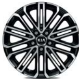
GT-LINE (DCT-Getriebe) Leichtmetallfelgen 18 Zoll mit 225/40 R18 Bereifung