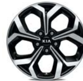
GOLD & PLATIN Leichtmetallfelgen 17 Zoll mit 225/45 R17 Bereifung