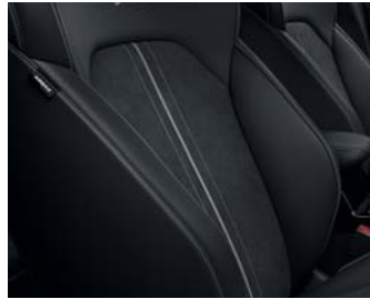
GT-LINE WK - Schwarz Veloursledersitze mit Echtleaderapplikation