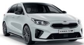
CASA WHITE (WD) 1,4