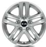
TITAN (optional P2) & SILBER Leichtmetallfelgen 16 Zoll mit 205/55 R16 Bereifung