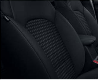
TITAN WK - Schwarz Textilsitze