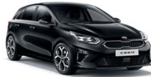
BLACK PEARL (1K) 3