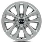
TITAN Stahlfelgen mit Radzierkappen 15 Zoll mit 195/65 R15 Bereifung