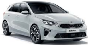
CASA WHITE (WD) 1