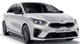
DELUXE WHITE (HW2) 3