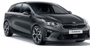
DARK PENTA METAL (H8G) 2