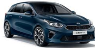
COSMO BLUE (CB7) 2