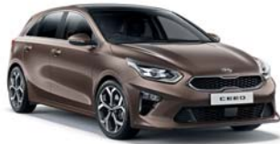
COPPER STONE (L2B) 2