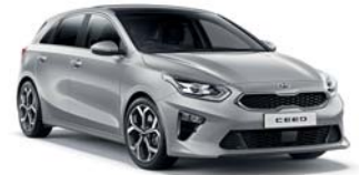
SPARKLING SILVER (KCS) 2