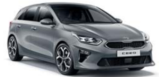
LUNAR SILVER (CSS) 2