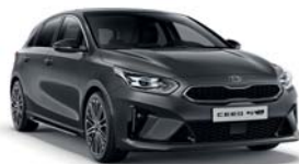
DARK PENTA METAL (H8G) 2