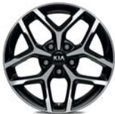
GT-LINE (MT-Getriebe) Leichtmetallfelgen 17 Zoll mit 225/45 R17 Bereifung