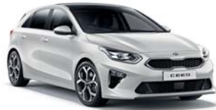
DELUXE WHITE (HW2) 3