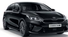
BLACK PEARL (1K) 3