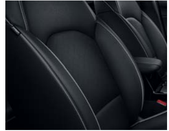
PLATIN WK - Schwarz Echtleadersitze