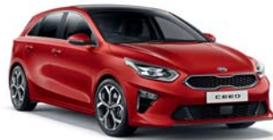
TRACK RED (FRD) 1