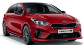
INFRA RED (AA9) 1,4*